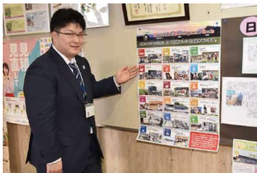
▲本支店に掲示予定のSDGs事業紹介のポスター