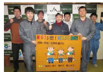
▲最優秀賞の七戸支部の看板と制作メンバー