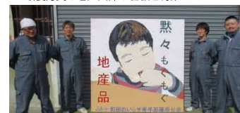
▲3位入賞の藤坂分会の看板と制作メンバー