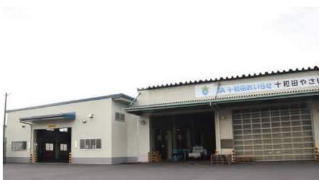
▲完成した「やさい集出荷施設」の増築部分(建物左側)

鉄骨造平屋建てで総工費は約1億5千万円、増築部分の762.35平方メートルと合わせた、やさい集出荷施設の総床面積は3,047.35平方メートル。増築部分ではニンニクの乾熱処理施設のほか、ゴボウ、ネギの共同選別の作業を主に行う計画です。