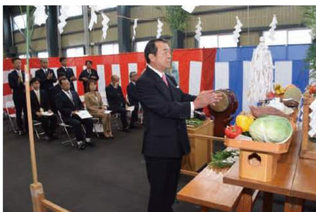
▲今後の安全と繁栄を祈り玉串を奉納する竹ヶ原組会長