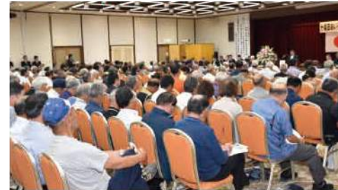
◎総代はJAや地域の将来につながる重要な役割です◎

JAの運営や事業活動は組合員のために行われています。どのようなJAにしたいのか、その方向性を全組合員の総意をもって決める必要があります。そこで総代が集まり、総代会でJAの運営方針など重要事項を決定します。