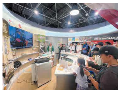
▲PR動画で管内の魅力をアピール!

当JA管内は2011年3月11日の東日本大震災で、津波による塩害や原発事故の影響で販売に苦慮してきました。PR動画ではJA職員や農家、地域住民が結集し、復興に立ち向かう姿や安全安心な農畜産物を提供するための土壌診断への取り組み、他産地との差別化に向けた6次産業化などを紹介。JA管内の生産者が「食べてけろー!」と来場者へ熱いメッセージを送りました。試食会では特許製法の低臭処理を施したニンニクを使用した「プレミアムにんにくパウダー」を振りかけたナガイモソーテーと「元気満点ドリンクにんにく魂」を提供。大阪市在住の40代女性は「栽培や加工品へのこだわりが見た目や味から感じ取ることができる。たくさん消費して復興産地を応援したい!」と話していました。