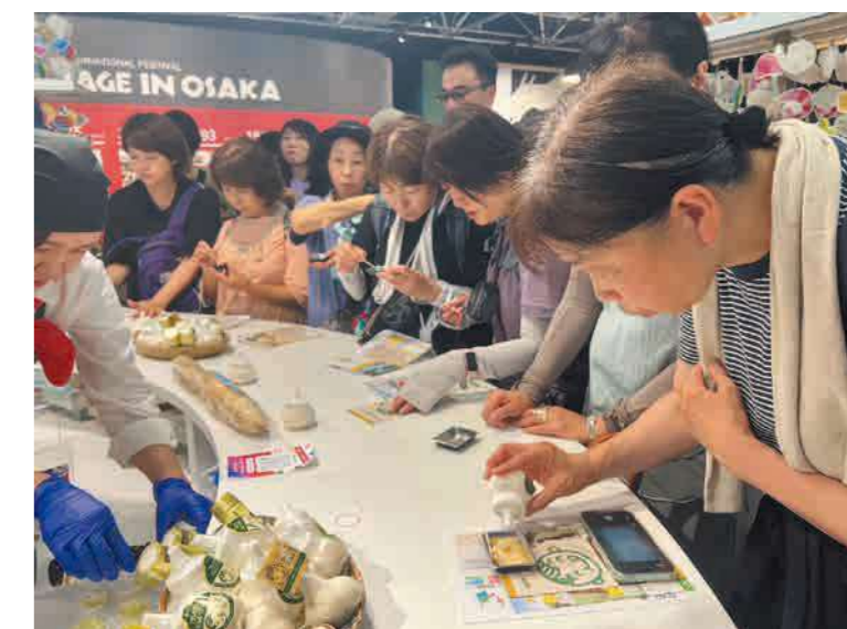
▲「プレミアムにんにくパウダー」を振ってナガイモソーテーを美食 ※このブースは(株)グルメ枡屋が運営する大阪木津市場と全国の震災復興産地が連携して展示するもので、同市場からの招待を受けて出展しました。