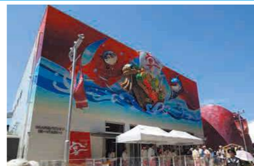
▲ORA外食パビリオン「宴~UTAGE」

令和7年4月13日から10月13日にかけて、20年ぶりに日本で万博が開かれています。今回の「大阪・関西万博2025」のテーマは「いのち輝く未来社会のデザイン」。会場では、最先端技術や、各国の歴史や文化などに触れることができます。JA十和田おいらせでは7月14日~20日の7日間、ORA外食パビリオン「宴~UTAGE」で展開する「オオサカkizuなイチバ」にゲスト出展し、試食やPR動画で、管内の広大な自然や自慢の農畜産物を国内外の来場者へアピールしました。