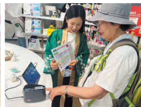
▲「ベジメータ」で野菜摂取量をチェック!