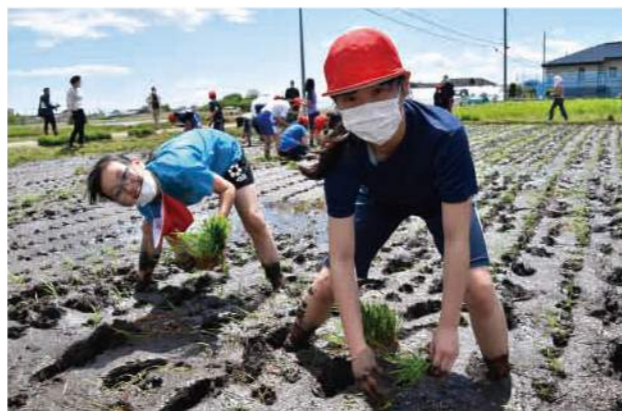
▲田植えを楽しむ児童(上北小)

JA共済の地域貢献活動事業を活用して、町内の米農家やJA職員、JA青年部員らが米づくりの一年を支援します。作業を終えた児童からは「ヌルヌルした泥が気持ち良い」「友達と一緒にできる作業が楽しかった」「どんな味がするのか楽しみ」との声が聞かれました。