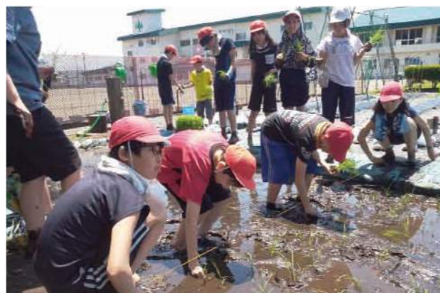
▶おいらせ町立下田小学校の5年生15人は5月28日、校内に設置した学校田に「まっしぐら」の苗を植えました。