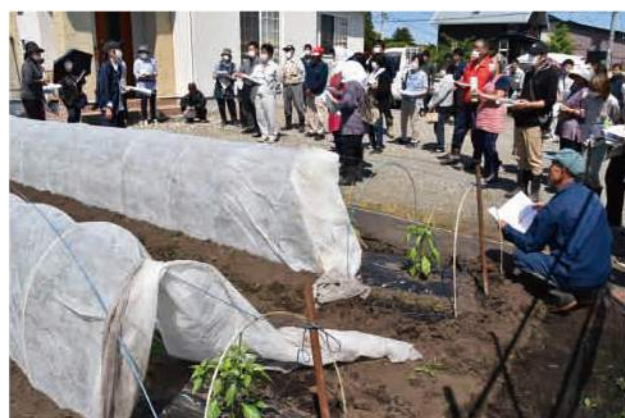
▲今後の栽培ポイントを学ぶ参加農家