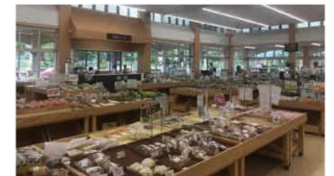
▲店内のイメージ写真

農畜産物…販売代金の15% 加工品…販売代金の16～20% ※2号会員はプラス2%