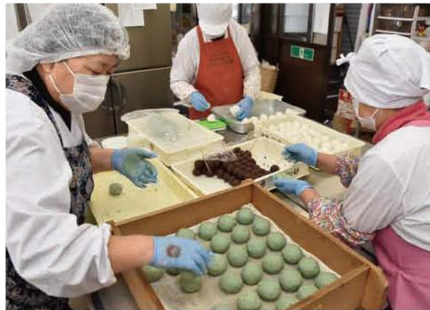
▲彼岸団子を手作りするメンバー

十和田やさい館では、ヨモギと白の2種類の団子を1個(100個)140円で通年販売しています。熟練の技で手作りするメンバーは「一つ一つ心を込めて作っている。ふっくら美味しい団子を味わってほしい」と話していました。団子を購入した70代女性は「毎年変わらない味でほっとする。出来立ての団子を先祖に供えたい」と笑顔を見せていました。