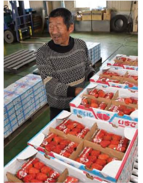
▲取れたての「ももいしいちご」を出荷する生産者

収穫は6月中旬まで続き、JAではシーズン出荷数量11トン、販売高1,300万円を見込んでいます。