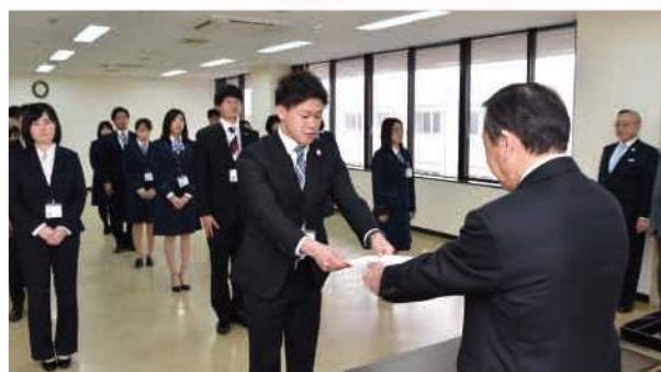
▲竹ヶ原組合長から辞令を受ける新採用職員