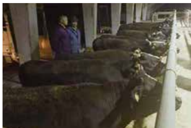
▲2日間かけ、陸送で鳥取県から到着した雌子牛