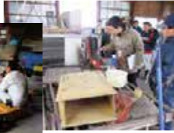
農業の現場を確認