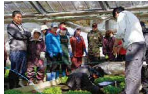
▲ピーマン苗の配布を待つ生産農家