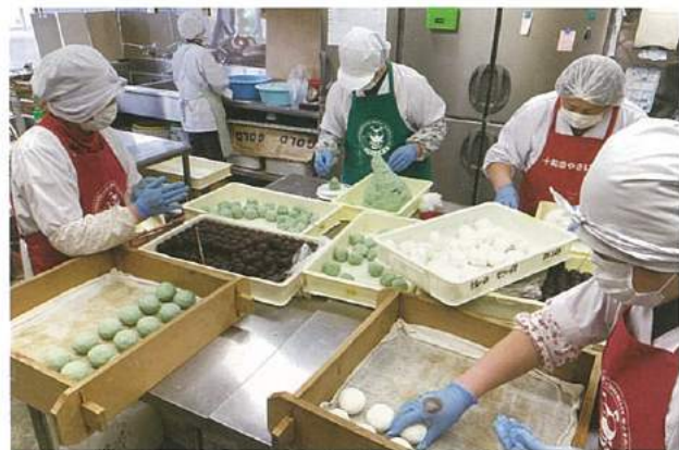
▲彼岸団子を手作りするメンバー

やさい館では、ヨモギと白の2種類の団子を1個(100g)130円で通年販売。熟練の技で手作りするメンバーは「年々、注文が増えている。おいしさの評判が広がっているのも要因の一つだと思う。心を込めてつくりたい」と話していました。