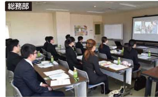
JA業務を紹介したスライド動画を観賞する新採用予定者

当JAは、JA事業を目で見て知ってもらおうスライド動画を制作しました。3月8日、今春採用予定者の入組前研修会で初めて公開。今後は、インターンシップ(職業体験)や学校の職場見学、職場体験などに活用し、JAの認知度アップを目指します。スライド動画は、教育人事課が立案、企画広報課が協力。各部署で働く現役職員が登場し笑顔で接している姿や、どのような業務かなどを写真で15分にわたって紹介しています。