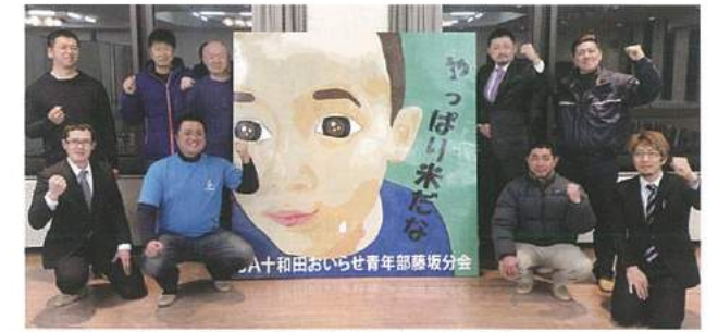
▲JA全中賞に入賞の看板を制作した藤坂分会のメンバー